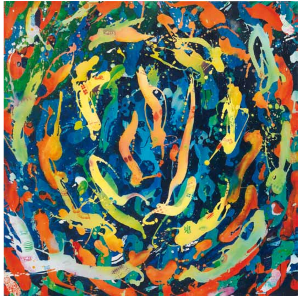
caged bird breaking free 2012 Acryl / Sprühlack auf Leinwand / 120 x 120 cm acrylic / spray paint on canvas / 47.2 x 47.2 in