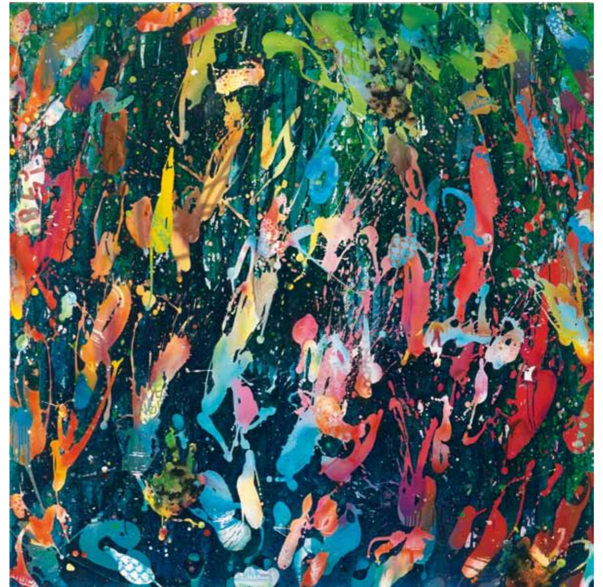
peppermint 2012 Acryl / Sprühlack auf Leinwand / 145 x 145 cm acrylic / spray paint on canvas / 57.1 x 57.1 in