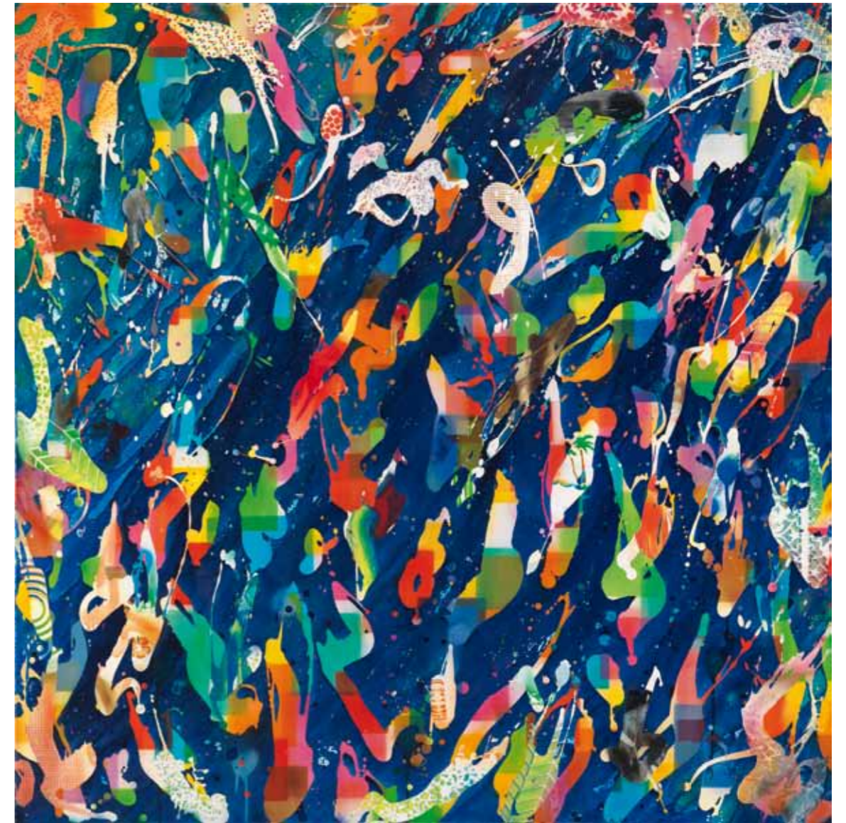
In color I trust 2012 Acryl / Sprühlack auf Leinwand / 145 x 145cm acrylic / spray paint on canvas / 57.1 x 57.1in