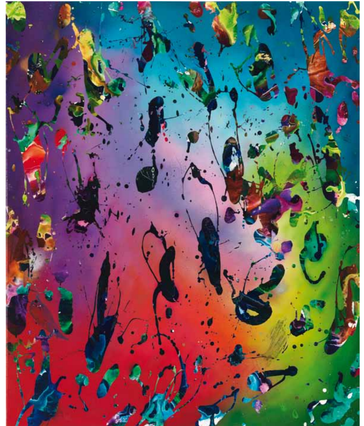
Sommernachtsflimmern 2011 Acryl / Sprühlack auf Leinwand / 120 x 100 cm acrylic / spray paint on canvas / 47.2 x 39.4 in