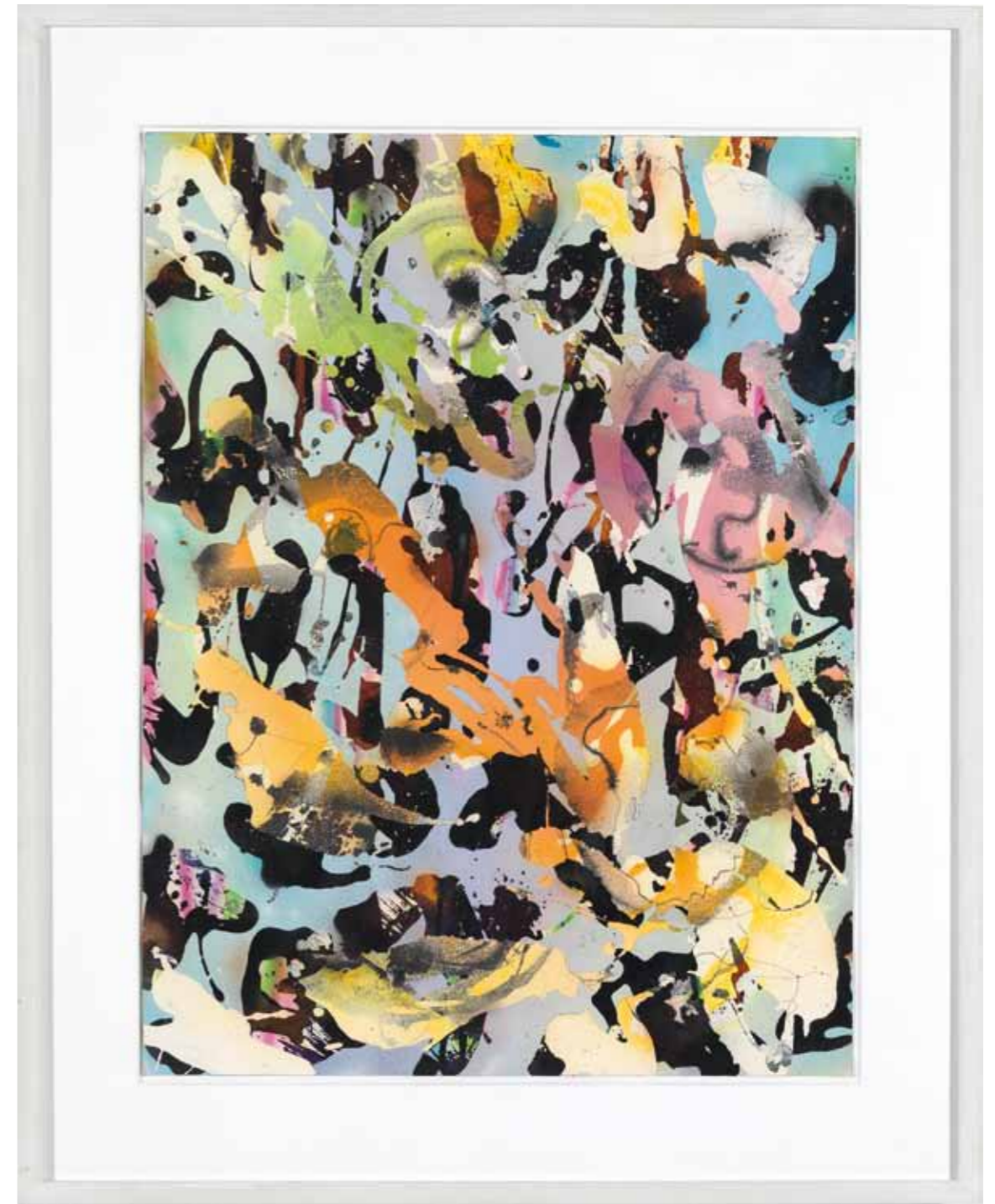
underdog 2012 Acryl / Buntstift / Sprühlack auf Papier / 61 x 46 cm acrylic / colored pencil / spray paint on paper / 24 x 18.1 in