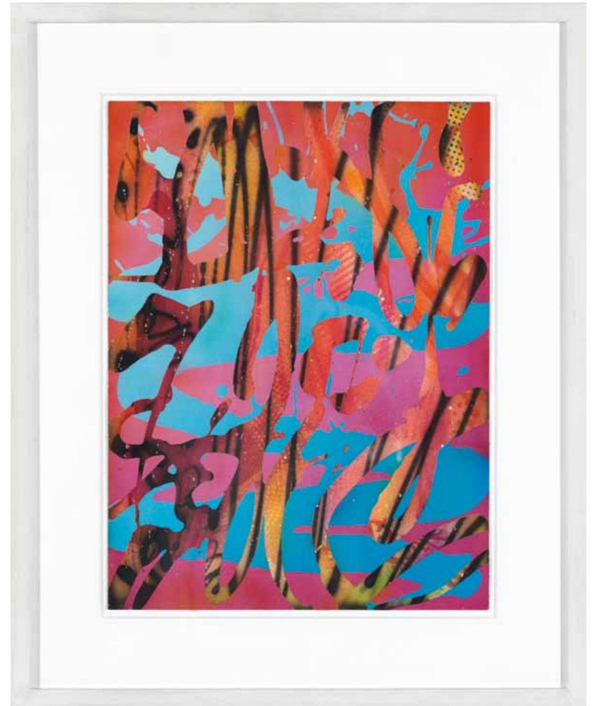
Madina 2012 Acryl / Sprühlack auf Papier / 40 x 30 cm acrylic / spray paint on paper / 15.8 x 11.8 in