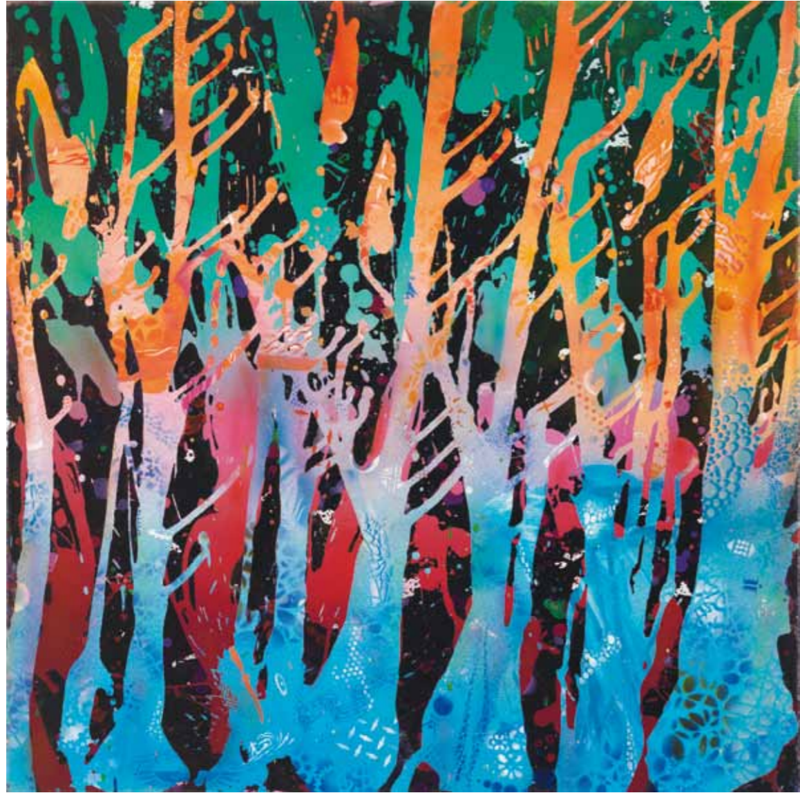
let me be your fantasy 2012 Acryl / Sprühlack auf Leinwand / 80 x 80cm acrylic / spray paint on canvas / 31.5 x 31.5 in