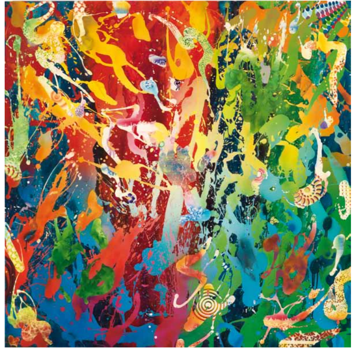
color craze 2012 Acryl / Sprühlack auf Leinwand / 145 x 145cm acrylic / spray paint on canvas / 57.1 x 57.1 in