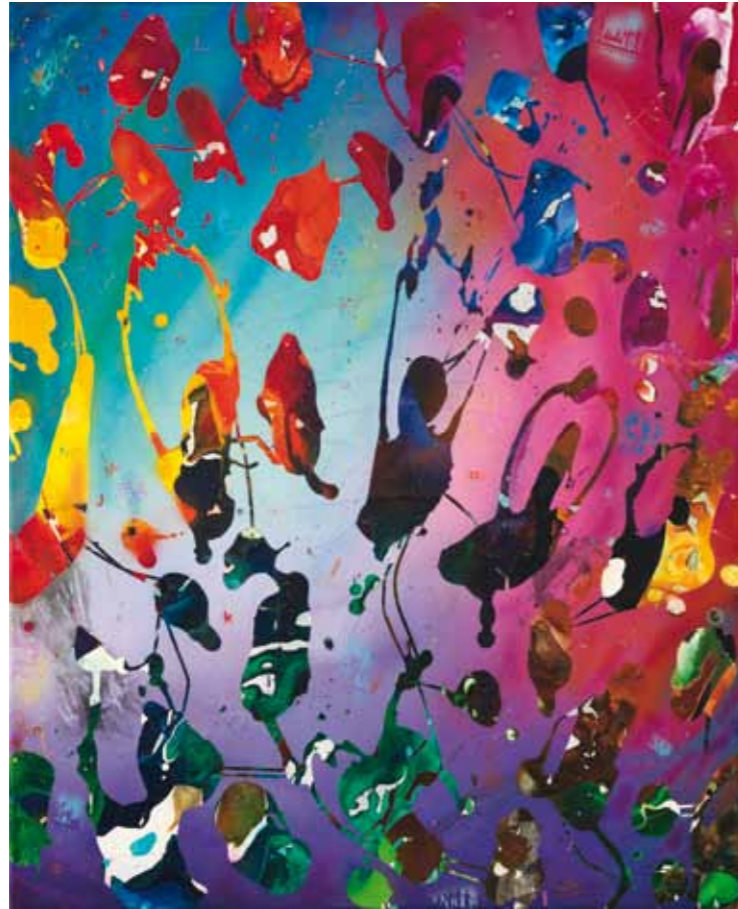
Miss Jackson 2011 Acryl / Sprühlack auf Leinwand / 80 x 65 cm acrylic / spray paint on canvas / 31.5 x 25.6 in