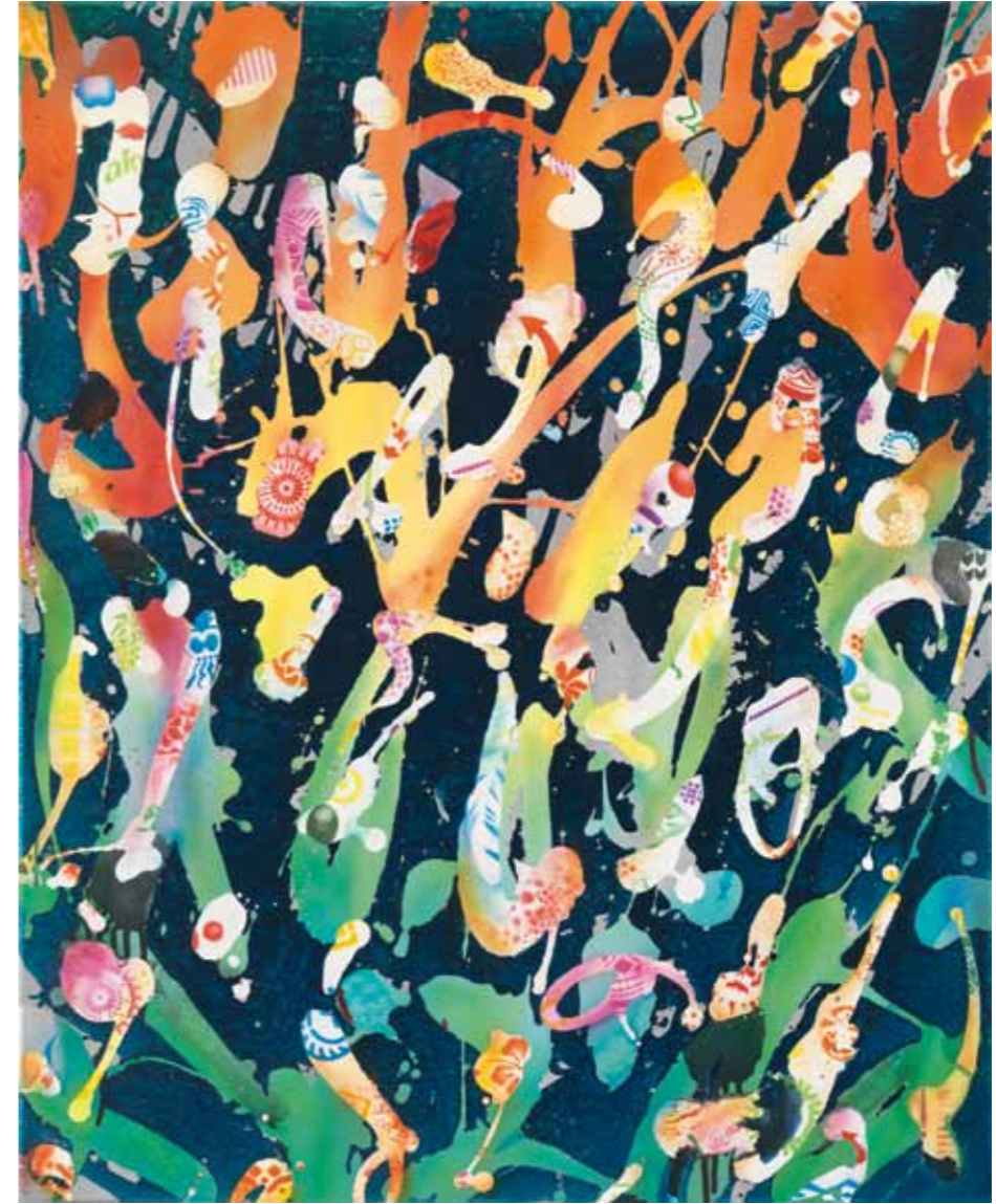
Pfersich 2012 Acryl / Sprühlack auf Leinwand / 80 x 65cm acrylic / spray paint on canvas / 31.5 x 25.6 in