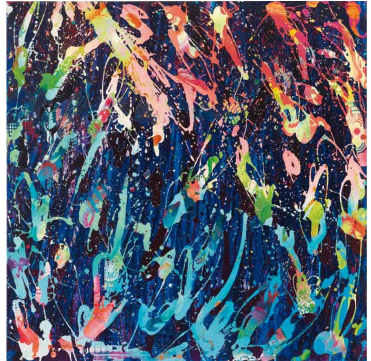
aquarius 2012 Acryl / Sprühlack auf Leinwand / 150 x 150 cm acrylic / spray paint on canvas / 59.1 x 59.1 in