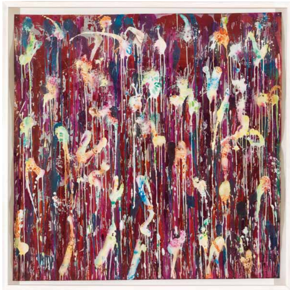
delight 2012 Acryl / Sprühlack auf Papier / 137 x 137cm acrylic / spray paint on paper / 53.9 x 53.9 in