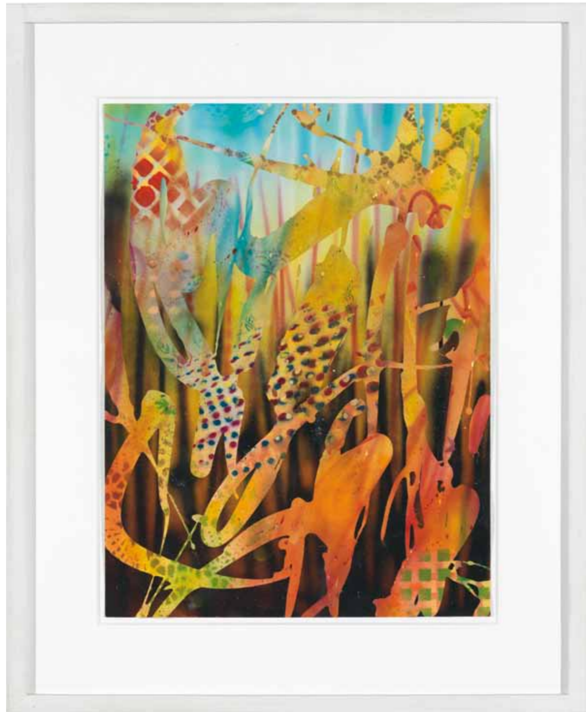
Wovon sollen wir träumen? 2012 Acryl / Sprühlack auf Papier / 40 x 30 cm acrylic / spray paint on paper / 15.8 x 11.8 in