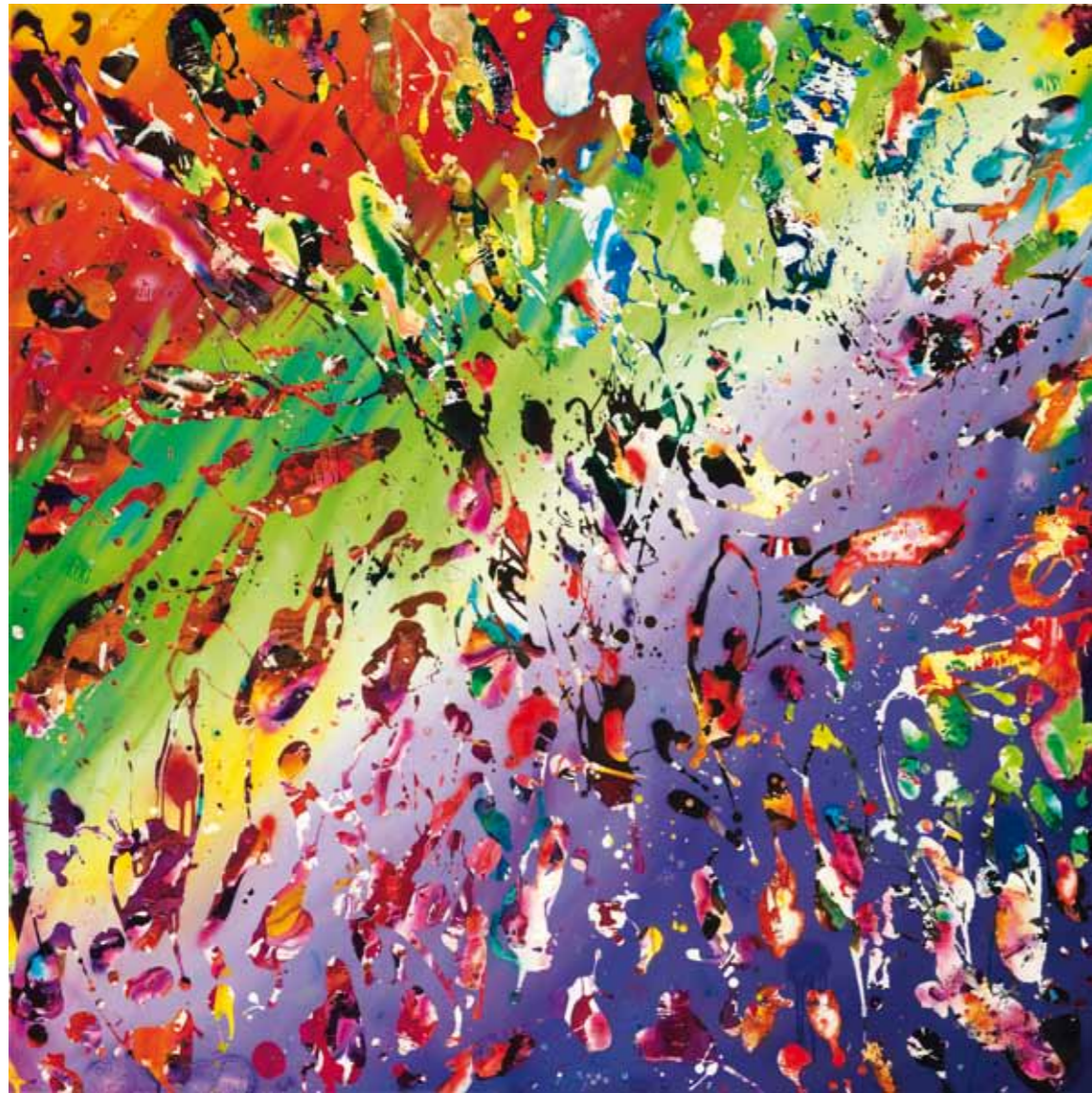
honey, girls r nothing but trouble 2011 Acryl / Sprühlack auf Leinwand / 145 x 145 cm acrylic / spray paint on canvas / 57.1 x 57.1 in