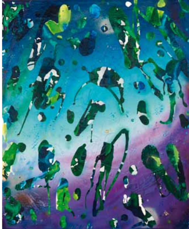
tell me 2012 Acryl / Sprühlack auf Leinwand / 60 x 50cm acrylic / spray paint on canvas / 23.6 x 19.7in