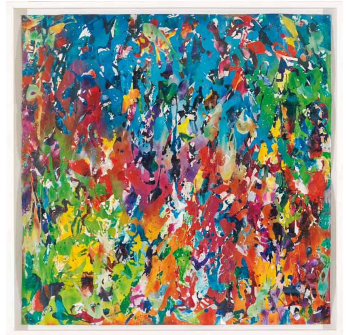
Jedem Anfang wohnt ein Zauber inne 2012 Aquarell / Acryl / Sprühlack auf Papier / 137 x 137cm water color / acrylic / spray paint on paper / 53.9 x 53.9 in